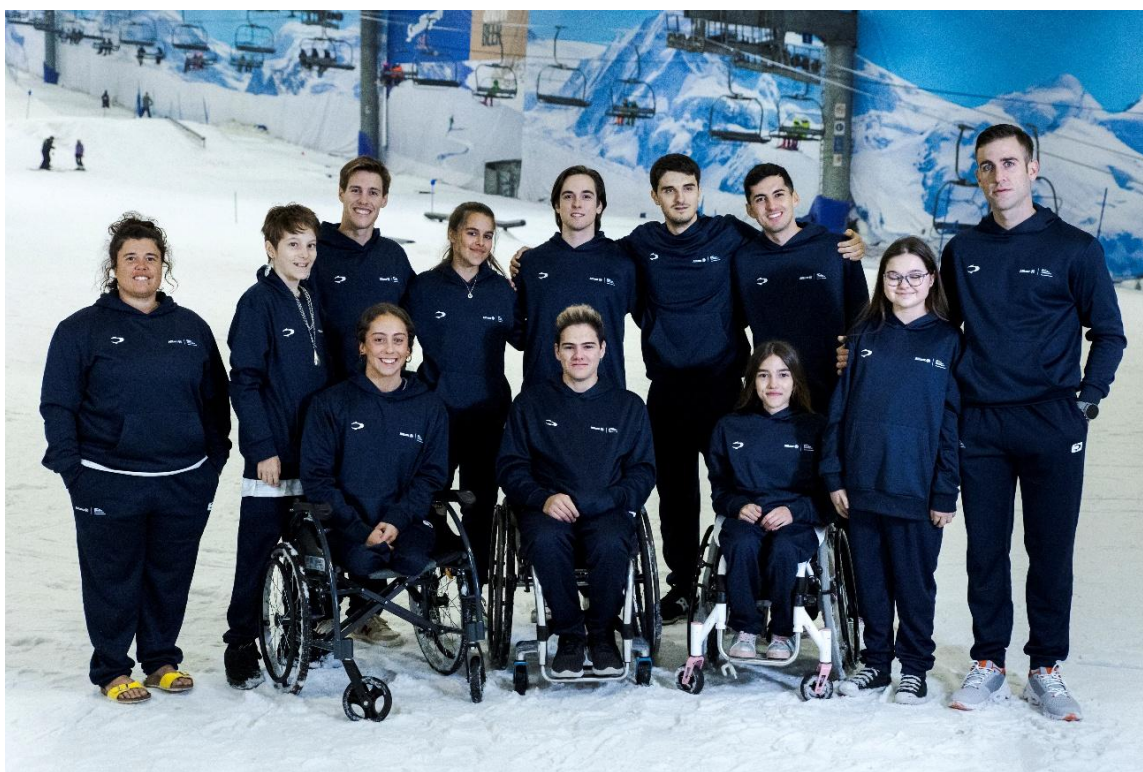
Concentración del Equipo Allianz de Promesas en 2022